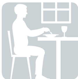
SITZEN beim Abendessen

Der erste Bericht des Leiters der obersten US-Gesundheitsbehörde, der den Zusammenhang zwischen körperlicher Inaktivität und Gesundheit darstellt, wurde 1996 veröffentlicht. Ähnlich dem 1964 veröffentlichten Bericht zum Thema »Tabak« beleuchtete er die breite Beweislage, die den sitzenden Lebensstil mit einer Vielzahl negativer Gesundheitsauswirkungen in Verbindung bringt. 10