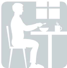
SITZEN beim Frühstück