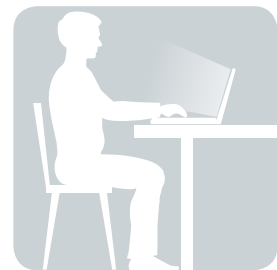
SITZEN vor dem Computer