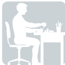
SITZEN in der Arbeit