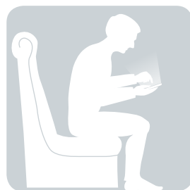
SITZEN über das Handy gebeugt