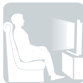
SITZEN vor dem Fernseher